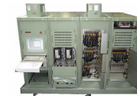
航空宇宙用機能試験装置