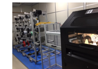
レーザーマーキングマシン