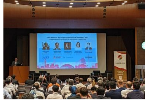
(上記写真はエアロマート名古屋2023の会場風景)

世界の航空宇宙産業集積都市で開催されている航空宇宙分野の世界的なビジネスマッチングイベントである「エアロマート」が、名古屋市で開催されます。